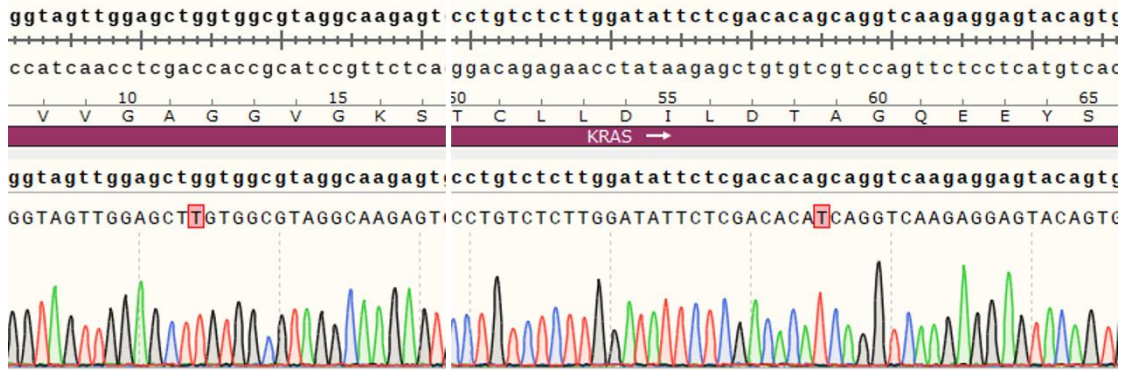
Fig 2. H_KRAS(G12C-A59S) BAF3 Cell Line 测序结果